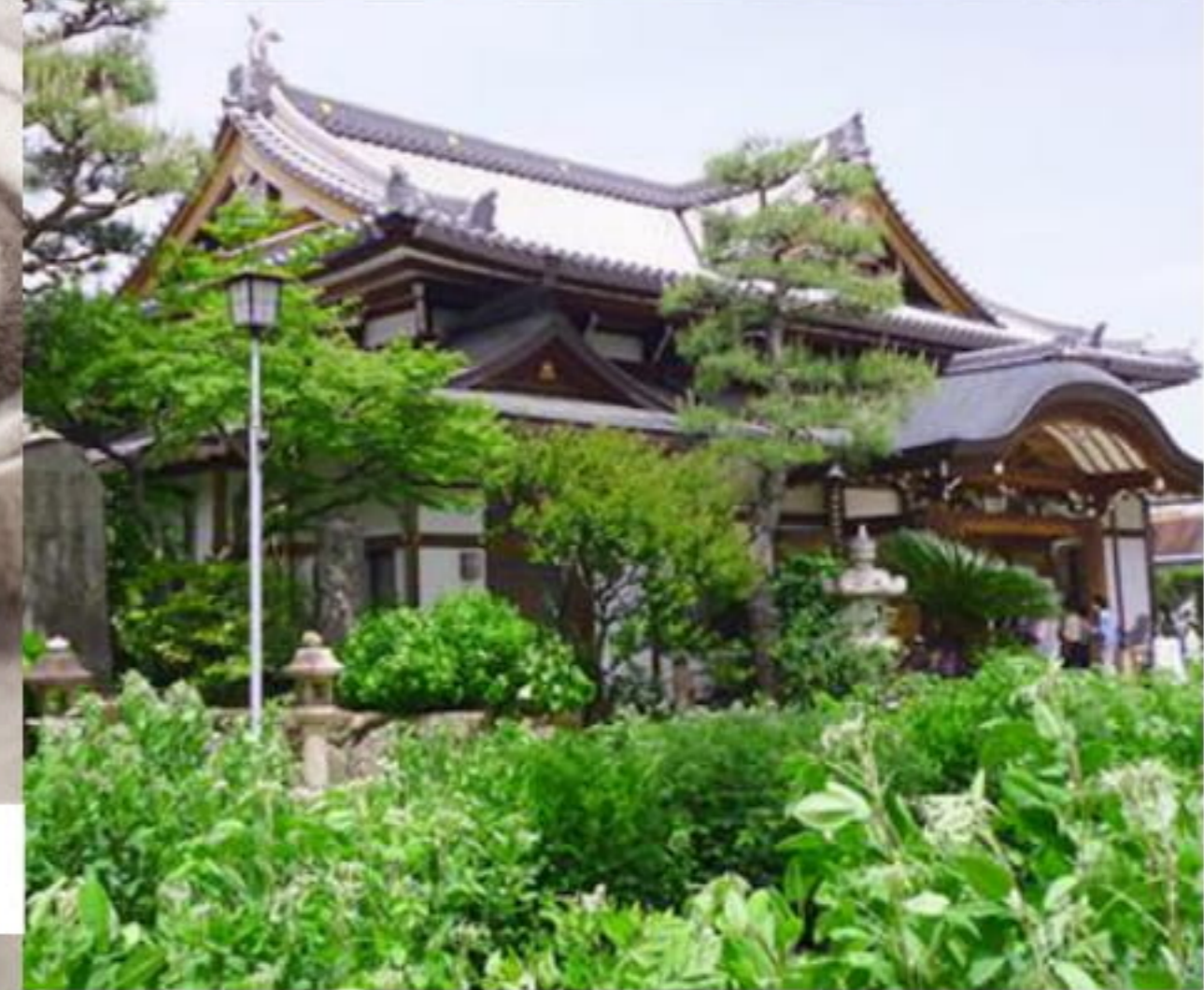
Zazen is a traditional Buddhist form of meditation which is known as zen meditation