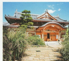
東光院 萩の寺 (南桜塚1-12-7)

普段聴く機会の少ない弦楽五重奏にどっぷり浸かる60分。ともすれば無意識に過ぎてしまう、日常にあって内に湧きあがる感情。ブラームスは晩年そのような音楽を創作していました。またヴィオラを2本使用し充実した内声が響きます。五人の奏者と一緒にブラームスの心の中を少し覗いてみませんか? (ヴィオラ/飯田)